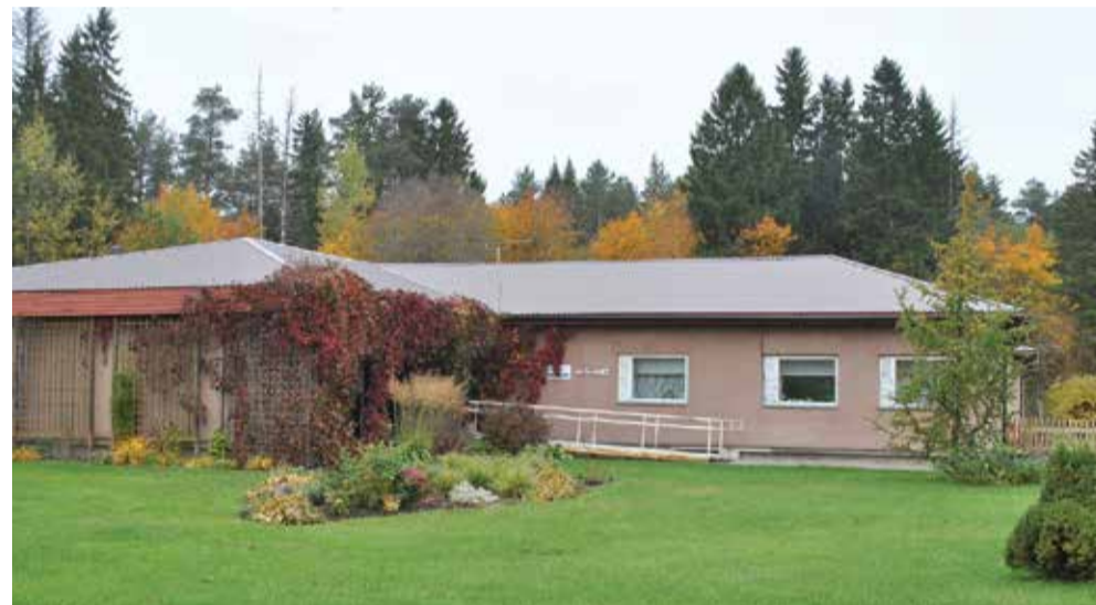
Ulvi hooldekodu sügisel.