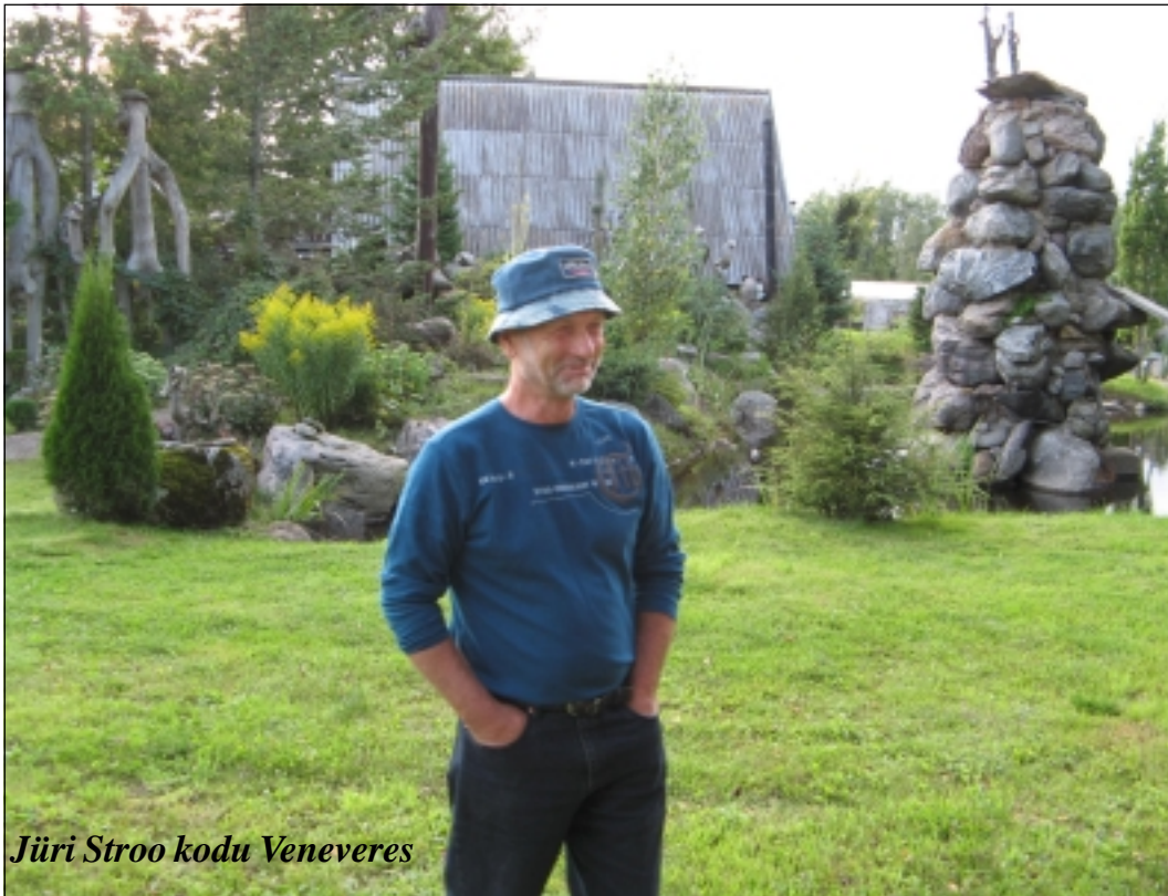
Jüri Stroo kodu Veneveres