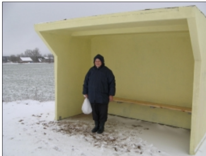
Moora külla paigaldati 19.novembril bussijaam