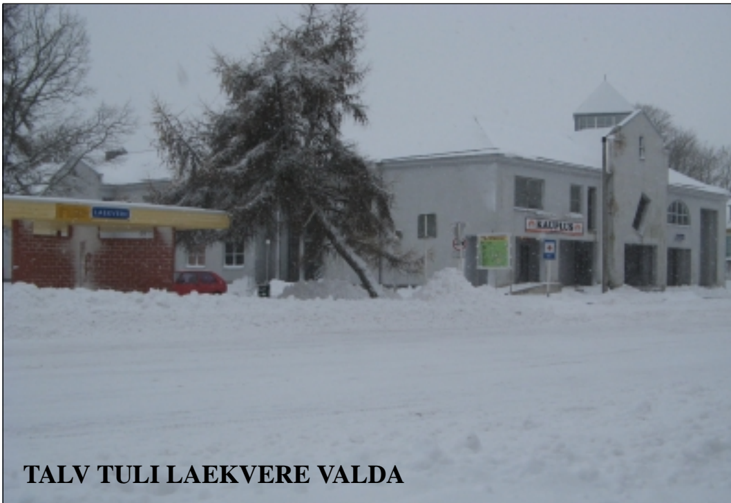
TALV TULI LAEKVERE VALDA