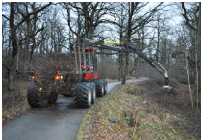
Hooldustööd Vinni-Pajusti tammikus.

SA Keskkonnainvesteeringute Keskus (KIK) eraldas Vinni vallale toetusraha, et saaksime hooldada kaitstavaid ja kultuuriloolisi loodusobjekte. Konkreetsest koostati Vinni mõisa pargi dendroloogiline hinnang, mida aluseks võttes saame kavandada pargi puistus raiet ja puude võrade hooldamist. Vinni-Pajusti tammiku Pajusti siht-