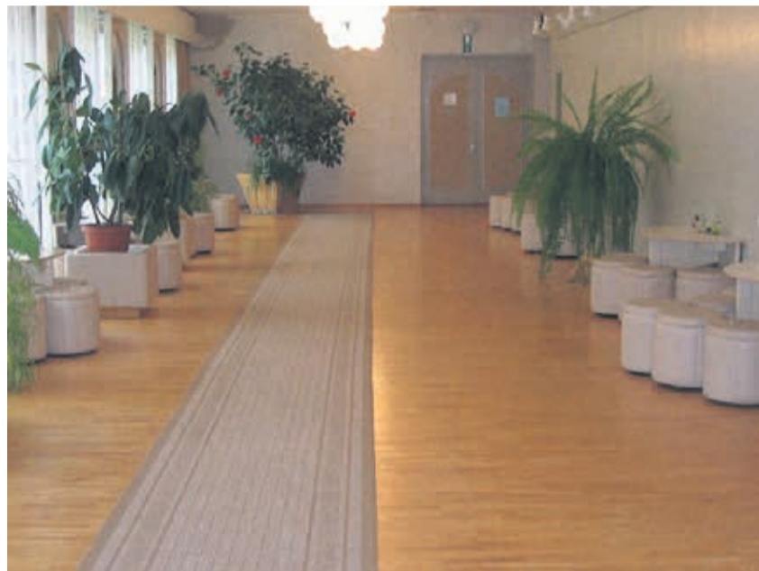
Laekvere Rahva Maja fujee

Kolmapäeval, 20. veebruaril kell 10.00 – eakate estraadiringi näidistund;