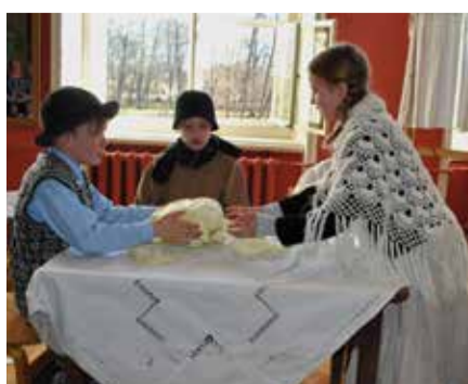
Tudu õpilased esinemas näitemängupäeval.